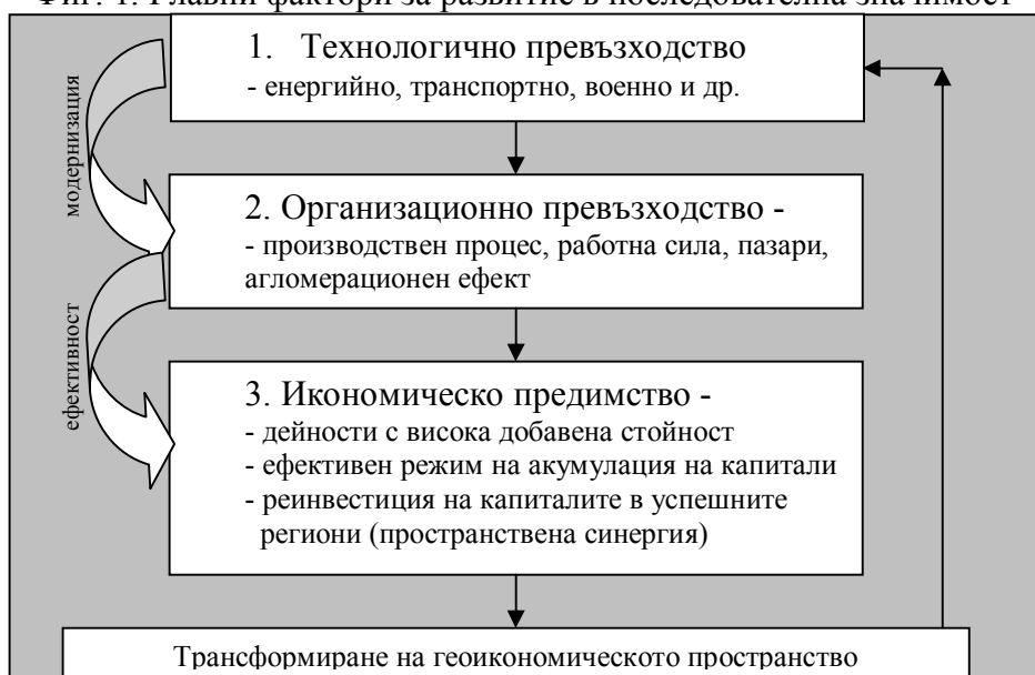
Фиг. 1. Главни фактори за развитие в последователна значимост

Именно географското пространство е константната величина в уравнението на историческите събития. Поради това, то често е подценено при оценката на факторите за всеобщото социално-икономическо, културно и политическо развитие. Доминираща теза в мисленето на мнозина, е че то е основен източник на ресурси и блага. Тази теза силно опростява и принижява значението на географското пространство, и неговата основополагаща роля. Историческите събития от времето на първата индустриална революция започнала около 1760г. във Великобритания и разпростряла се в последствие в целия свят е протоизточник на съвременния глобален геоикономически модел. Той черпи своята научна същност от три фундаментални фактора, между които има пряка и обратна функционална връзка: