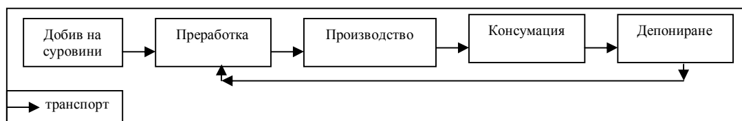
Фиг. № 3 Линеен модел на отношение към ресурсите

В последните години, се полагат усилия част от депонираните отпадъци да се преработват и връщат в процеса на преработка и производството на изделия с вторичен характер. Друга позитивна тенденция е изграждането на ПСОВ пречистващи каналните води (битови и промишлени) преди да се заустват в реките. Въпреки това модела си остава линеен и решава проблемите частично. Видно е, че най-често срещата дейност в този модел е транспорта. Преодолявайки дистанцията решава основен географски проблем – неравномерния достъп до стоки и услуги. По този начин, се натрупва транспорта ставка на всеки производствен етап. Последното условие значително увеличава цените на крайните продукти и услуги и трансформира проблема с ефективността в локализационен . Увеличените нива на цените от последните 60г. както е видно в цикъла на Кондратиев се дължат именно на тези допълнителни услуги за населението и възможността да се извлече добавена стойност от дизайн, стил и начин на живот от традиционни стоки (въплътено в търговските марки). Иначе, производствената система всяка година генерира повече в количествено отношение, на относително константни цени за единица продукт.